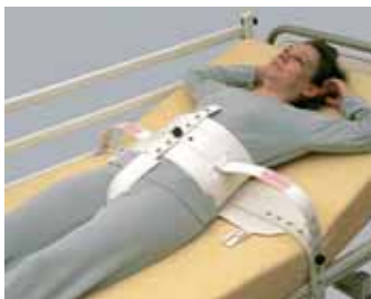
65-2221 Segufix-vyö perusmalli, haaravyöllä S-XL