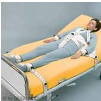
65-2222 Segufix-vyö täydennetty malli, haaravyöllä S-L