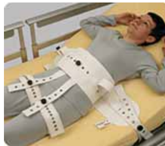
65-2231 Segufix-vyö perusmalli, reisivöillä S-L